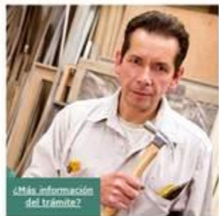
¿Más información del trámite?

Verifica si estás vigente desde internet. Solicita tu Constancia de Vigencia de Derechos. Ten a la mano tu CURP, Número de Seguridad Social (NSS) y un correo electrónico personal.